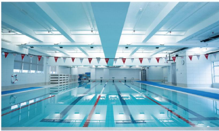
25米全年恆溫標準游泳池